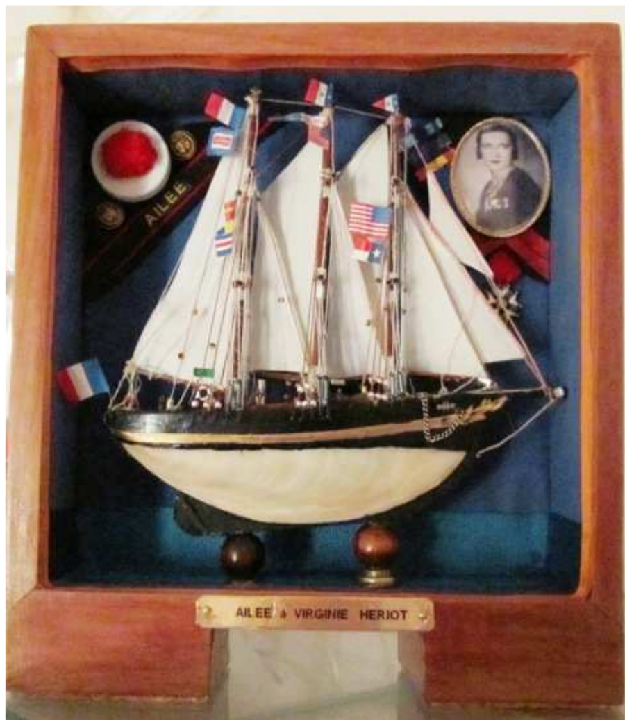
La boîte allégorique terminée