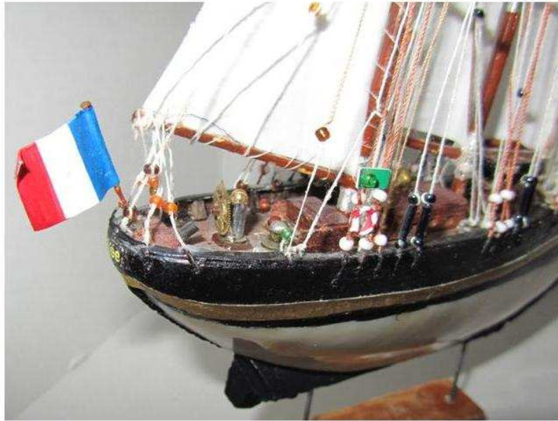
Détails de la coque

Détails vus de l'arrière : mat d'artimon avec sa voile triangulaire, les haubans avec les caps de moutons, les ridoirs, le feu vert tribord, en dessous une bouée rouge et blanche, sur le pont la barre à roue en cuivre la table à cartes, entre les deux mats le rouf avec ses hublots, sous la quille on voit le gouvernail qui est fonctionnel.