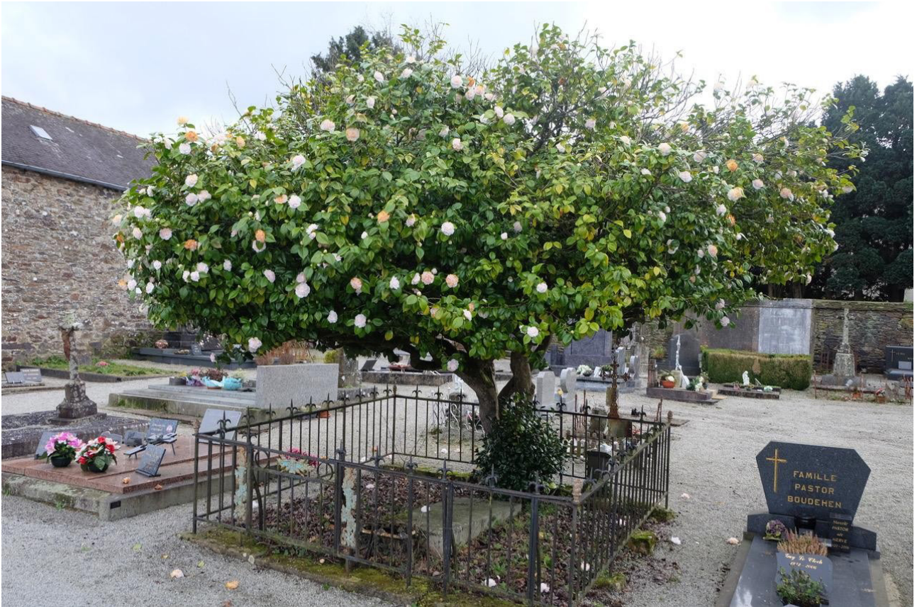
Sépulture de Victor Grenet dans le cimetière de Carhaix

Lorsque l'on pénètre dans le cimetière de Carhaix par l'allée principale, sur la gauche, une tombe entourée d'une petite grille est reconnaissable car abritée par un arbuste. C'est la sépulture de Victor Grenet, officier de la Légion d'honneur.