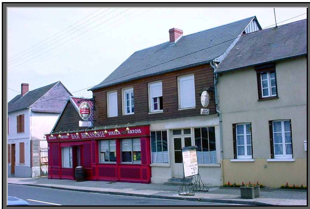
La même vue, en juin 2003