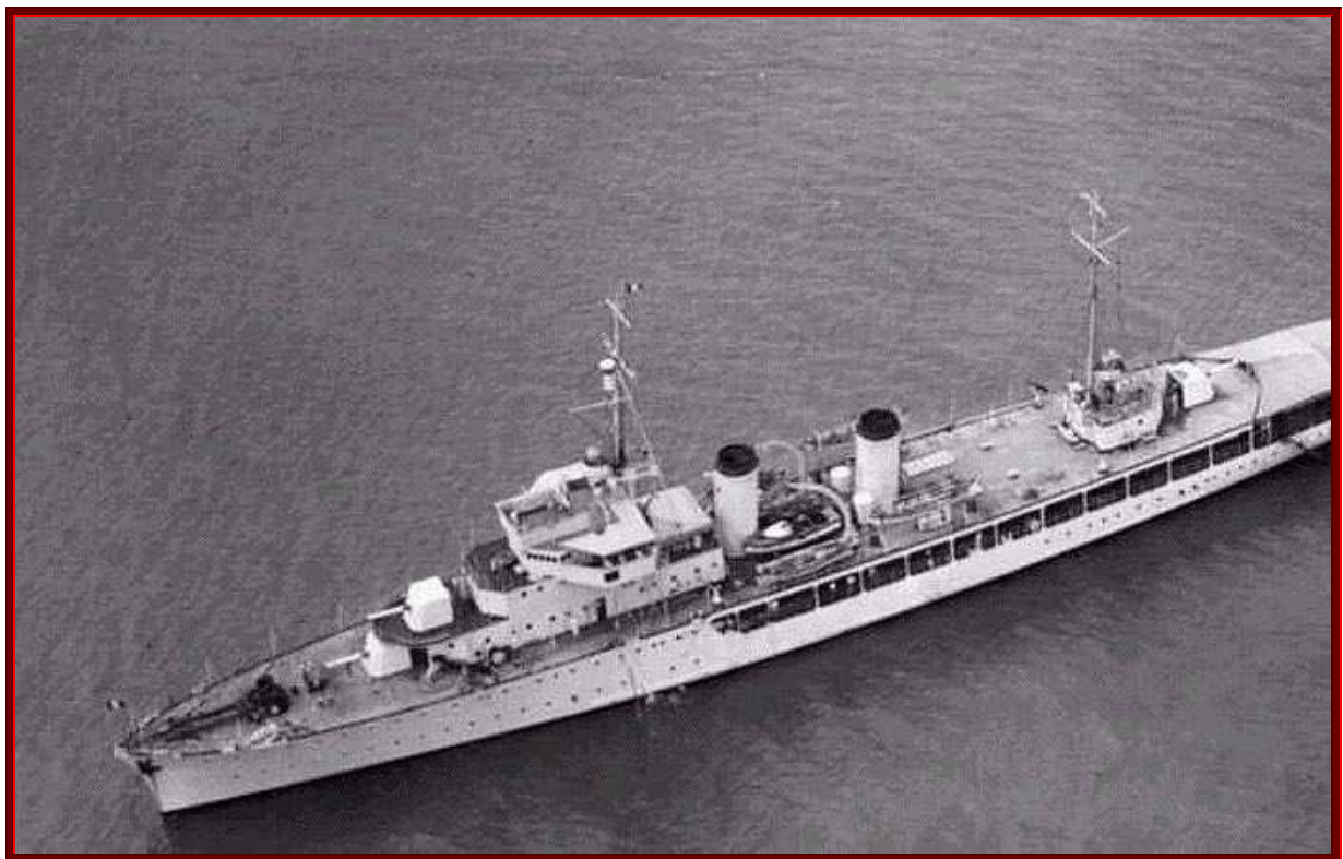
Vue aérienne du BOUGAINVILLE en 1933. 2600 tonnes, 104 mètres, 16 nœuds, 3 canons de 138 mm, 1 avion.

A 28 ans, il est garçon-coiffeur, quartier-maître de 1 ère classe au 1 er Régiment des Fusiliers de Marine, ce qui correspond au grade de caporal-chef dans l' Armée de Terre ou de l' Air.