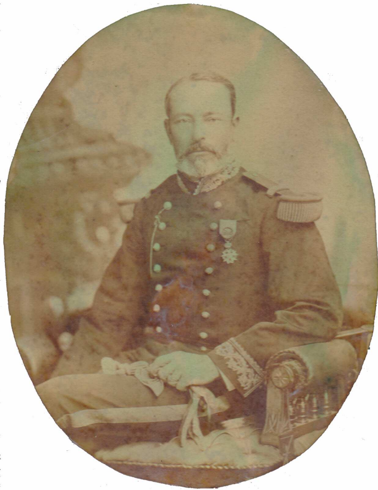
Photo prise en tant qu'officier de la légion d'honneur et contre amiral donc vers 1888

Vêtement de contre amiral, Neuf boutons, broderie d'une seule rangée, feuille de chênes avec ancres.